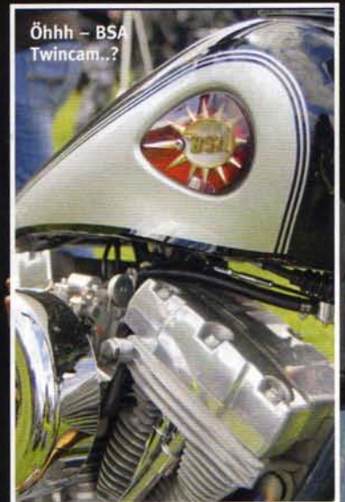
Öhhh - BSA Twincam..?