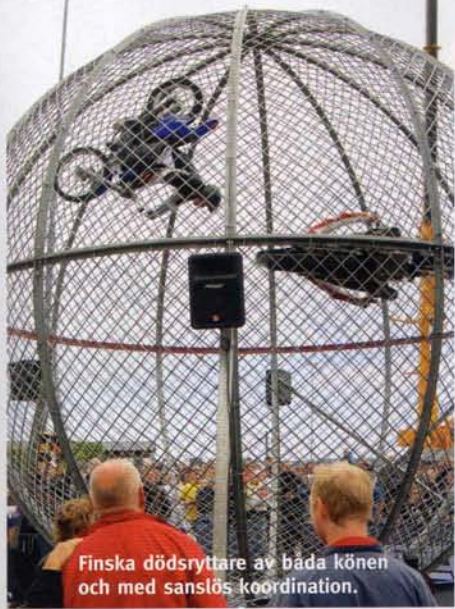
Finska dödsryttare av båda könen och med sanslös koordinaton.