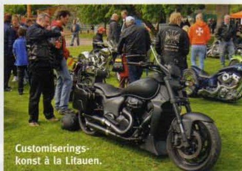
Customiseringskonst à la Litauen.