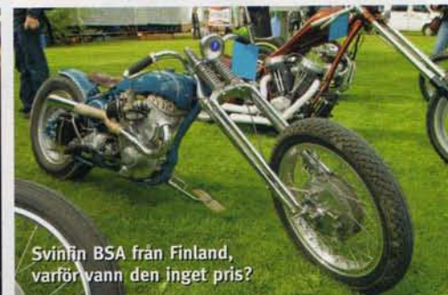
Svinfin BSA från Finland, varför vann den inget pris?