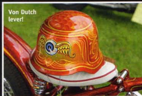
Von Dutch lever!