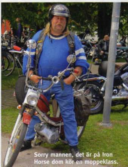
Sorry mannen, det är på Iron Horse dom kör en moppeklass.