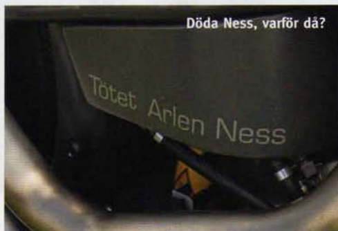
Döda Ness, varför då?