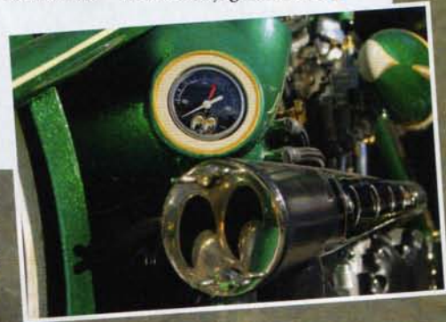
Moon-ögon är typiskt Hogtech.