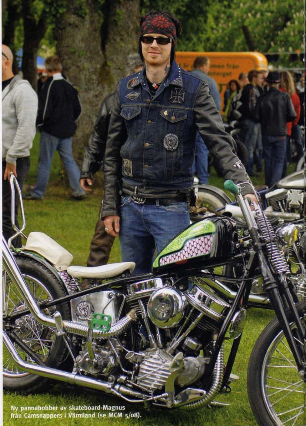
Ny pannabobber av skateboard-Magnus från Camsnappers i Värmland (se MCM 5/08).

Trots kylan fanns det gott om långväga gäster och vi såg folk från både södra Frankrike, Ryssland, England, Tyskland, Schweiz, Baltikum och Italien. En italienare vid namn Giordano