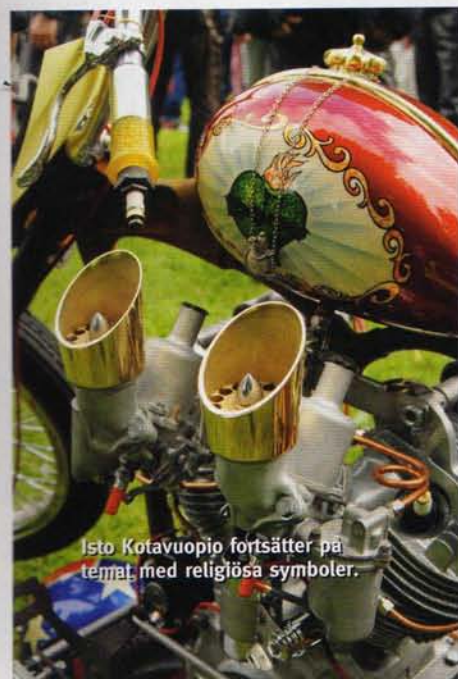
Isto Kotavuopio fortsätter på temat med religiösa symboler.