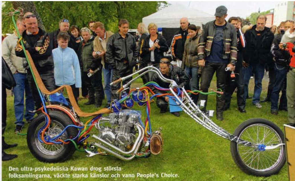
Den ultra-psykedeliska Kawan drog största folksamlingarna, väckte starka känslor och vann People's Choice.