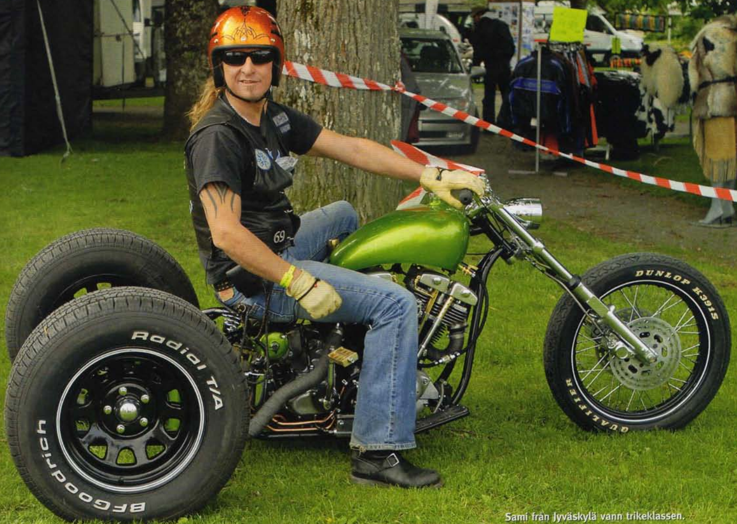
Sami från Jyväskylä vann trikeklassen.