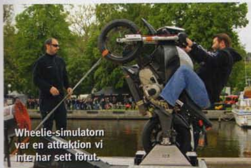
Wheelie-simulaton var en attraktion vi inte har sett förut.