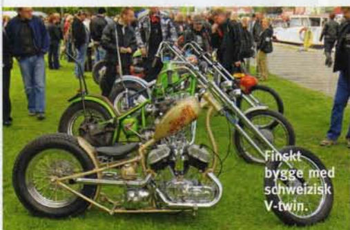
Finekt bygge med schweizisk V-twin.

Custom Bike Show är fortfarande störst, bäst och vackrast! Den perfekta inledningen till sommaren. Yes yes, nu är det sommar igen, såväl i Roslagen som annorstädes. Och se så många blommor som redan slagit ut på ängen... ●