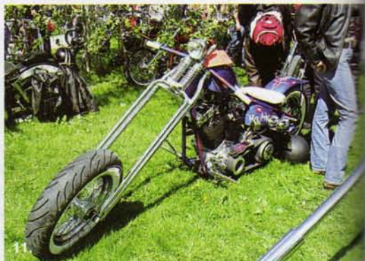
1. Siistiä ruotsi-customia. 2. Societetsparken. 3. Kerran kunnolla tehty toimii kauan. Tämä vanha Lätyskä-kopteri Gorr MC:ltä säilyttää joka vuosi uudestaan. 4. Somistukset ovat harvinaisia.